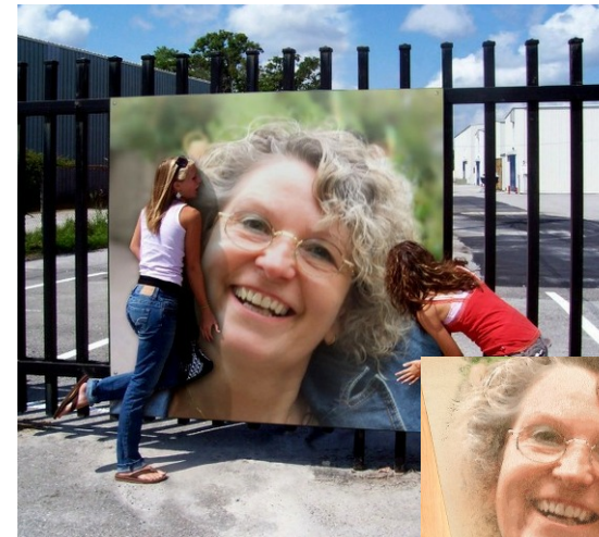
Was heute technisch alles möglich ist!

Mein Mann erstellt Ihnen gegen einen Unkostenbeitrag, Plakate und Flyer, aber auch Vorlagen für Ihre Webseite und Beamer.